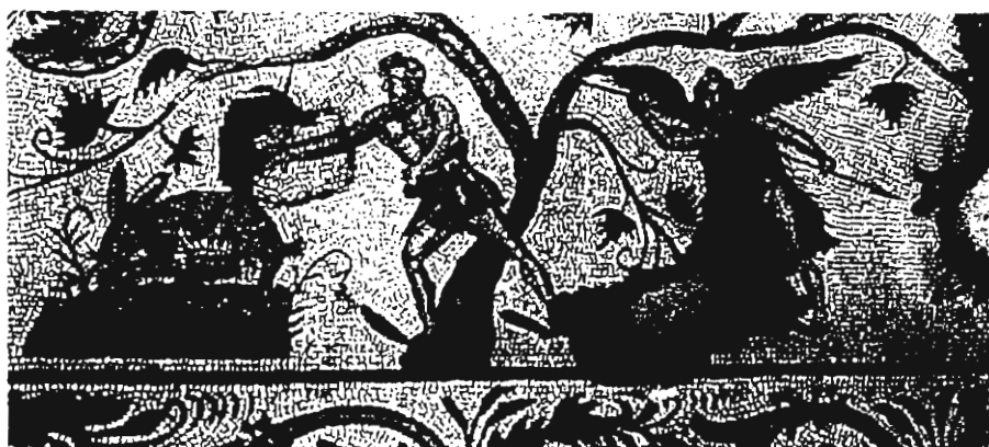
Σκηνές τρύγου. Ψηφιδωτό «Οικία Διονύσου», Πάφος, Κύπρος

«ὅτι μὲν ἐκ τῶν τρεφόντων ἐστὶν ὁ οἶνος, ἅπαντες ὁμολογοῦσι καί εἶ γε τό τρέφον ἅπαν τροφή ἐστὶν, ρητέον ὡς εἴη ἂν ἐκ τοῦ γένους τῶν τροφῶν καί ὁ οἶνος...» (Περὶ δυνάμεως τροφῶν, 4, 2). 3