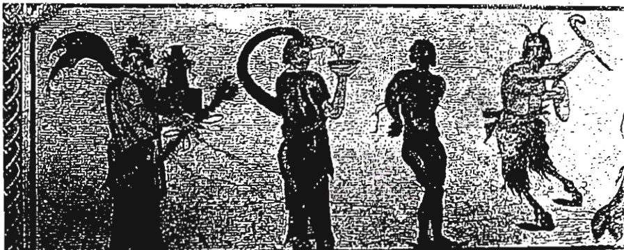
Σκηνές από το θρίαμβο του Διονύσου. Ψηφιδωτό «Οικία Διονύσου», Πάφος, Κύπρος

Απόσπασμα από το βιβλίο «ΘΕΩΝ ΚΑΙ ΑΝΘΡΩΠΩΝ ΠΑΘΗ», Εκδόσεις ΒΗΓΑ, Αθήνα 2000 (Μέρος Α': Οίνος: Το φάρμακο και το φαρμάκι)