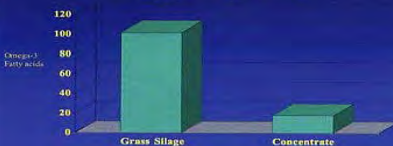
Figure 1. Omega-3 fatty acids in muscle of 24-month old Aberdeen Angus cross steers (mg per 100g muscle)